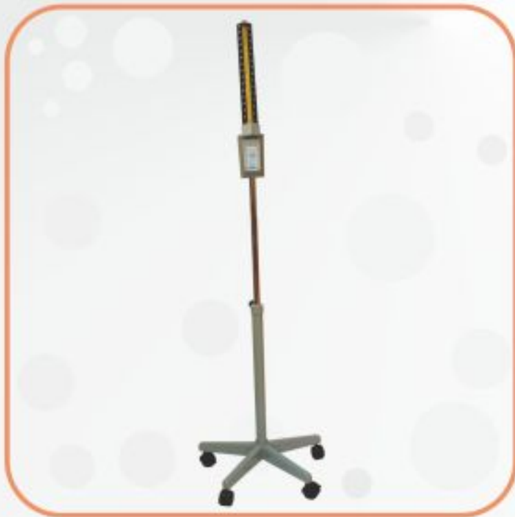
فشارسنج جیوه‌ای پایه دار مدل TXJ-30A