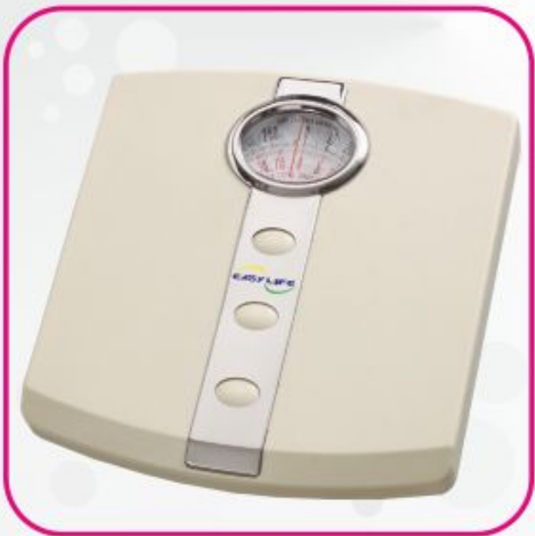
ترازو عقربه ای مدل BR-301