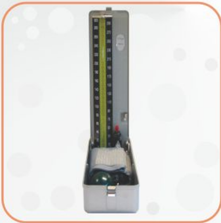
فشارسنج جیوه‌ای رومیزی مدل TXJ-10A