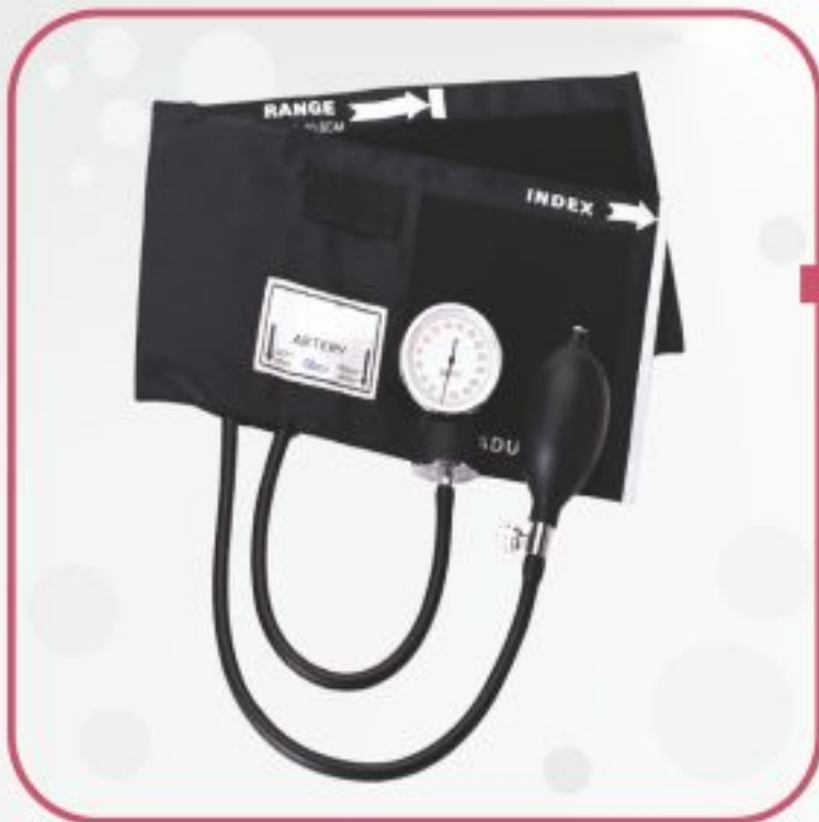
فشارسنج عقربه‌ای بازویی مدل HS-2000