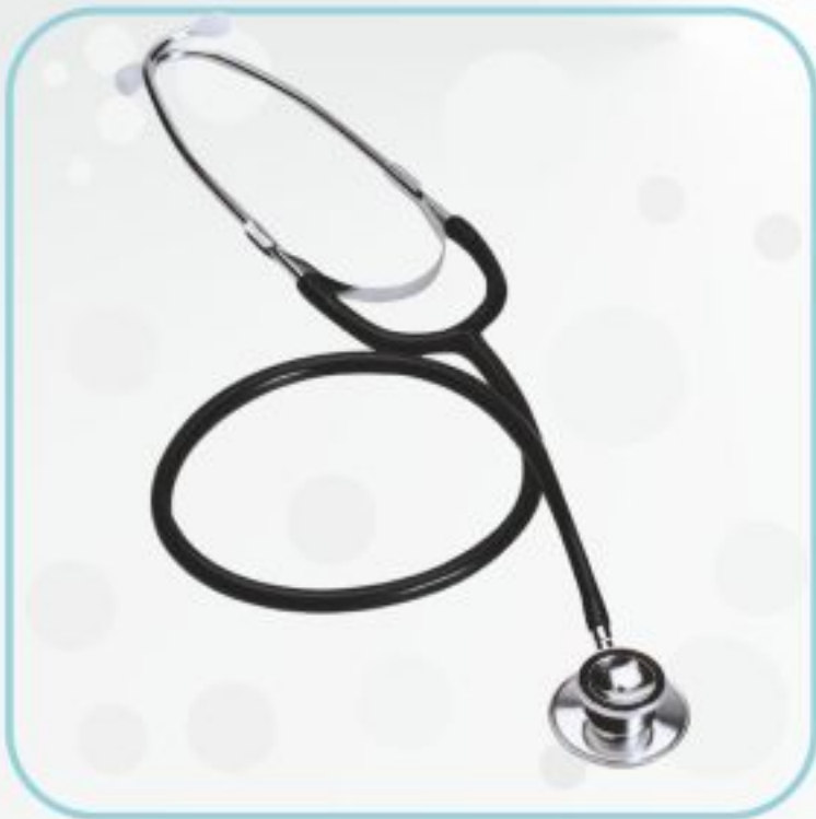
گوشی پزشکی دوبل مدل HS-30B (بزرگسال و اطفال)