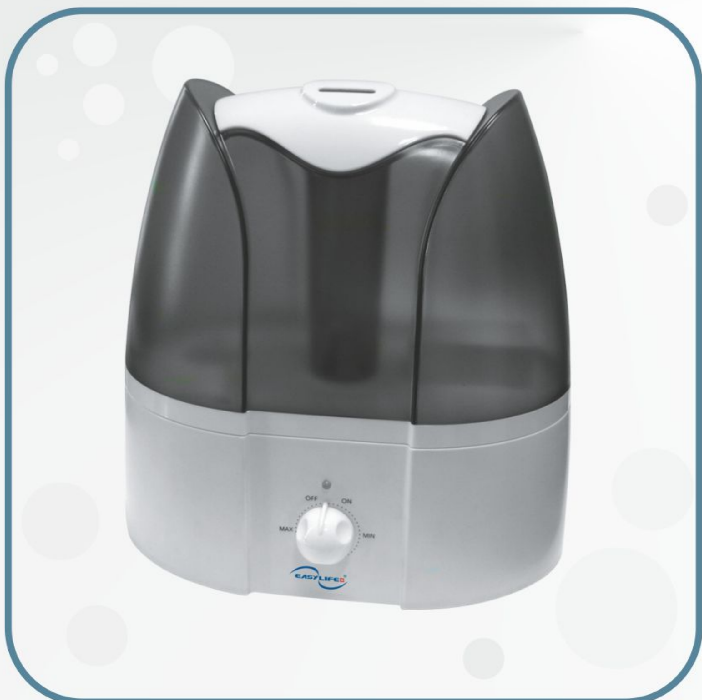
بخور سرد مدل GS-668