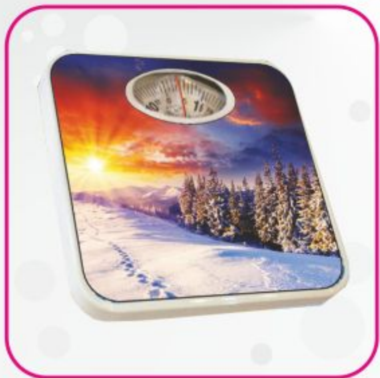
ترازو عقربه ای مدل BR 1999 B