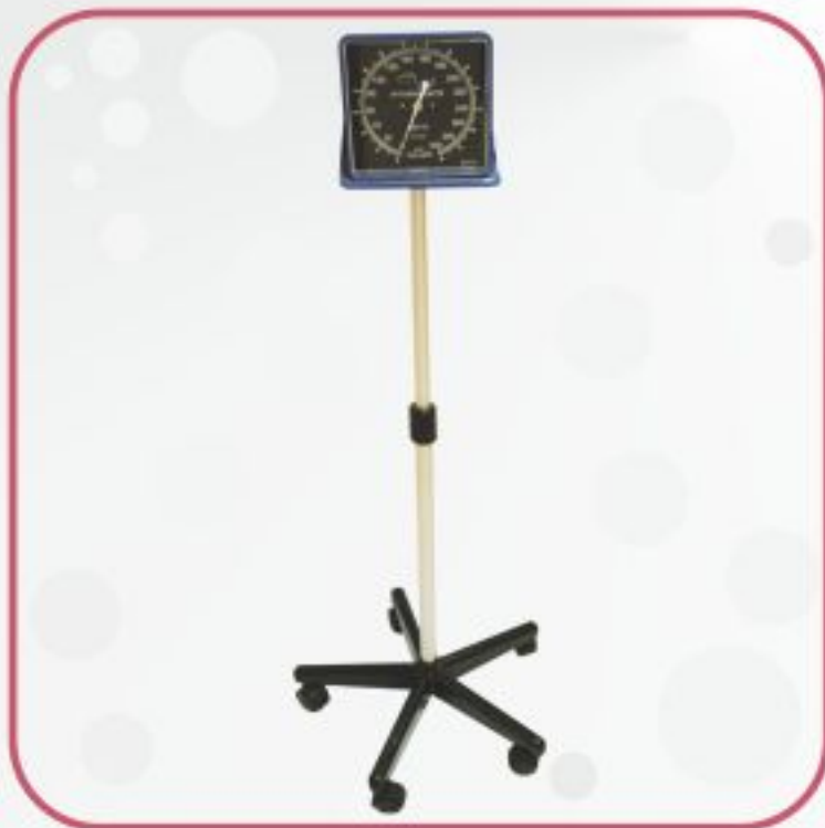
فشارسنج عقربه‌ای پایه دار مدل HS-70A