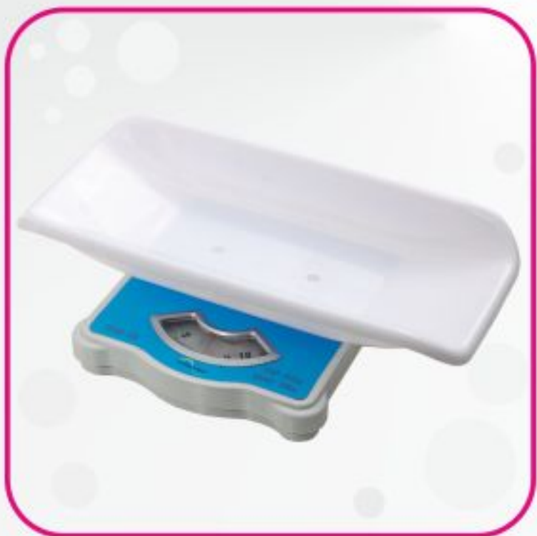
ترازوی عقربه ای اطفال YRBB-20