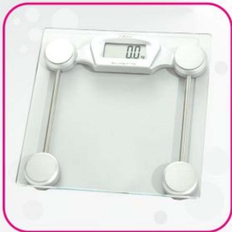
ترازو دیجیتال مدل EB2032