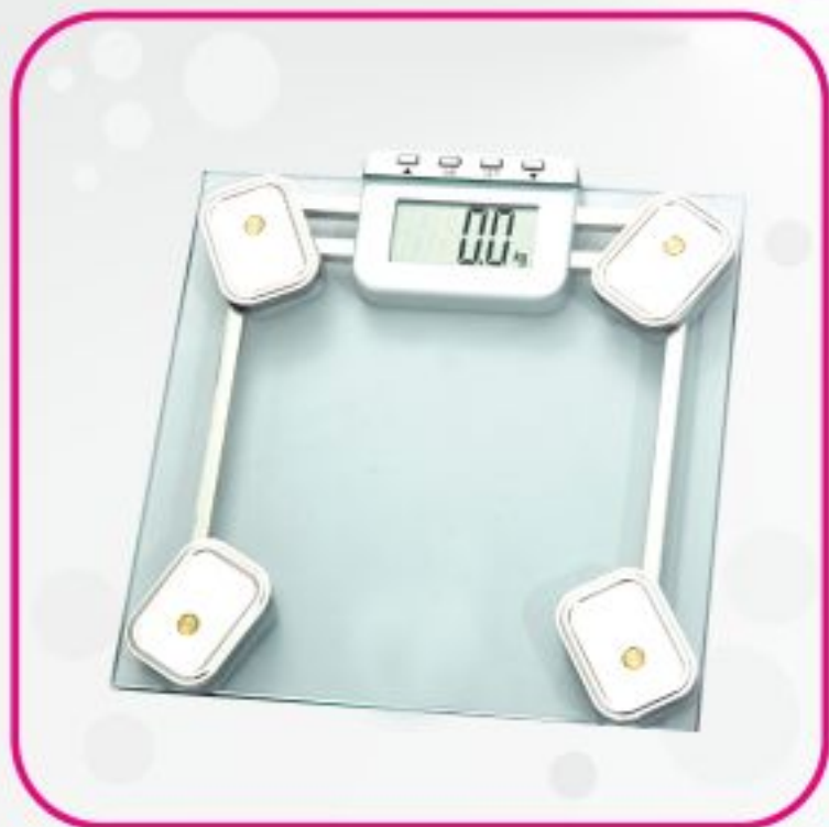
ترازو دیجیتال مدل BF05