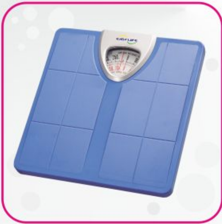
ترازو عقربه ای مدل BR 2010