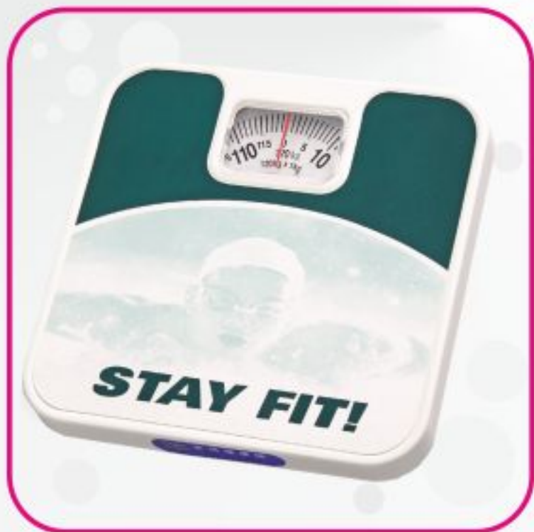
ترازو عقربه ای مدل BR 9312