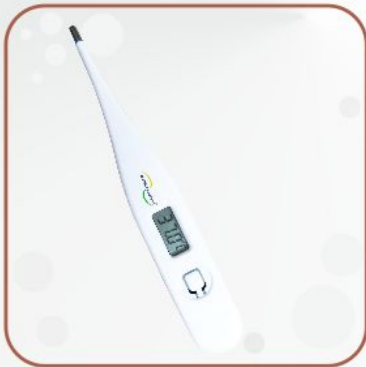
ترمومتر دیجیتال مدل MT-101