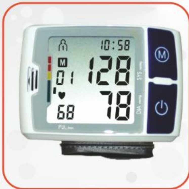
فشارسنج مچی دیجیتالی KD-7902