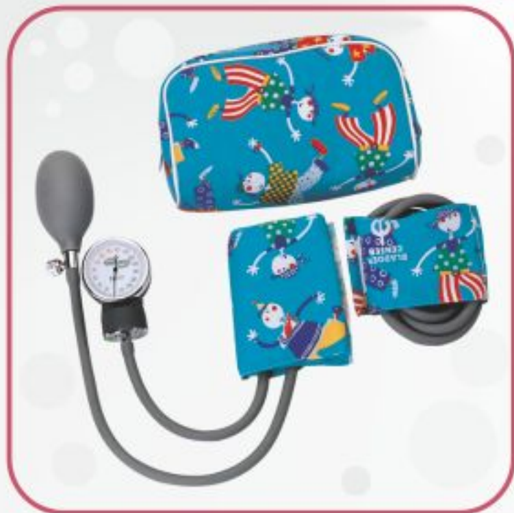
فشارسنج عقربه‌ای با زویی مخصوص اطفال مدل HS-20A