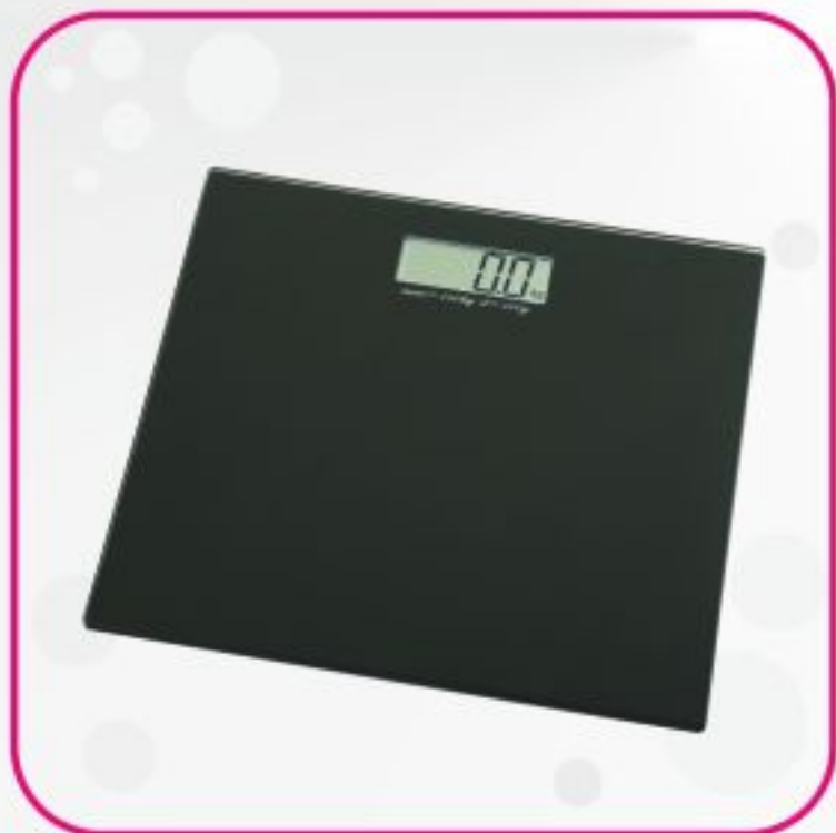
ترازو دیجیتال مدل EB2039