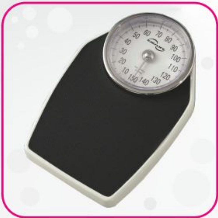
ترازو عقربه ای مدل DT-01