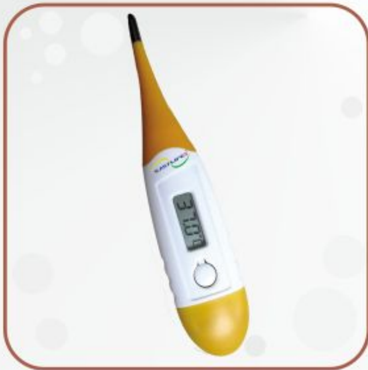
ترمو متر دیجیتال مدل MT-402