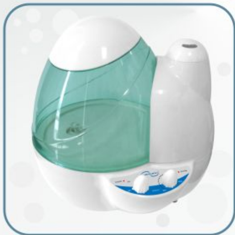
بخور سرد مدل GS383-A