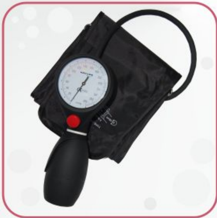
فشارسنج عقربه‌ای HS-201T