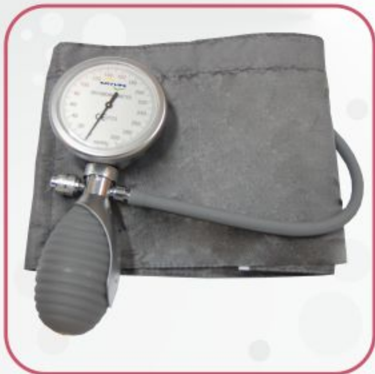
فشارسنج عقربه‌ای HS-201Q1