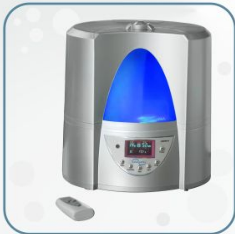
بخور سرد مدل GS528-A