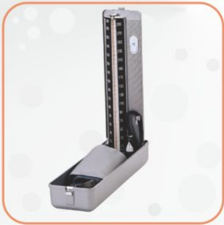
فشارسنج جیوه‌ای رومی‌زی مدل TXJ-10B