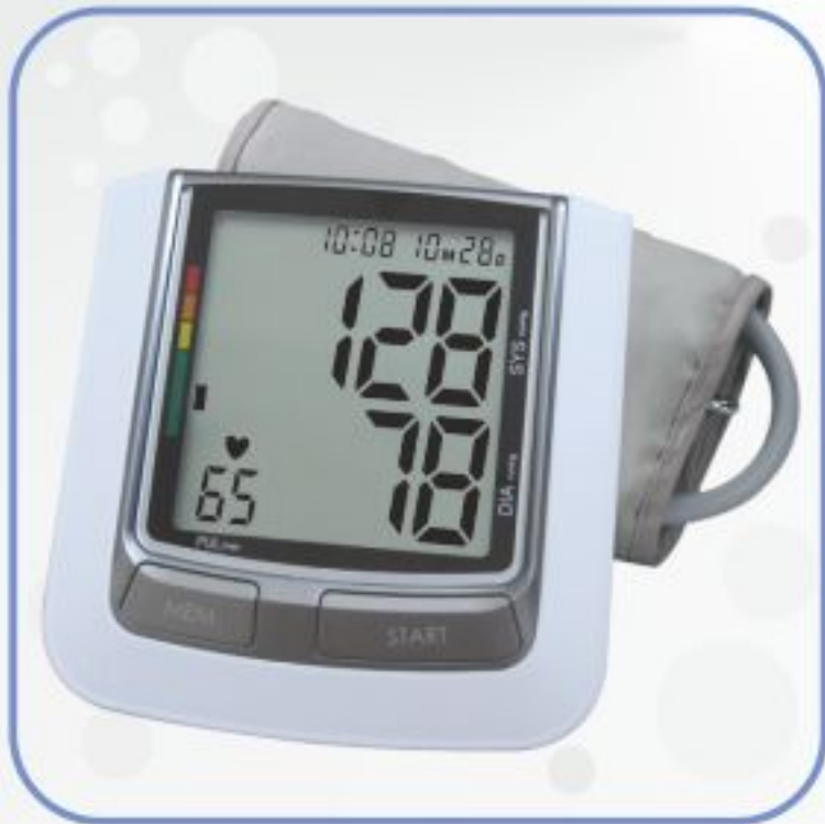
فشارسنج تمام اتوماتیک بازویی مدل KD-5917