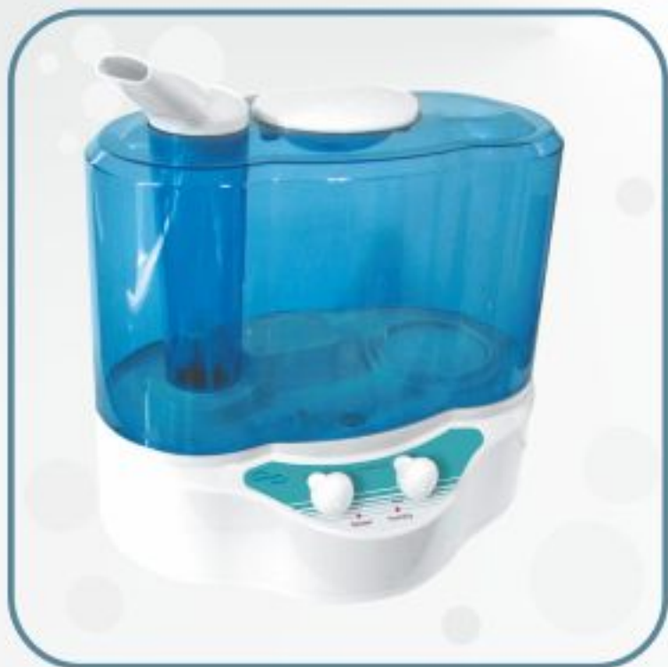
بخور سرد مدل GS398-B